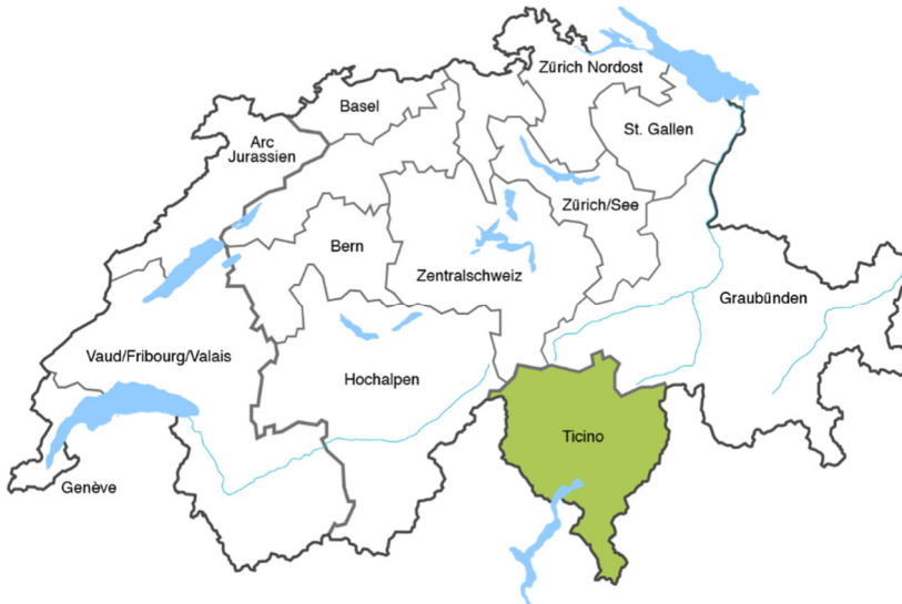
Fig. 2: Potere sull'opinione regionale del Gruppo Corriere del Ticino Quote di potere globale sull'opinione negli spazi mediatici del gruppo industriale